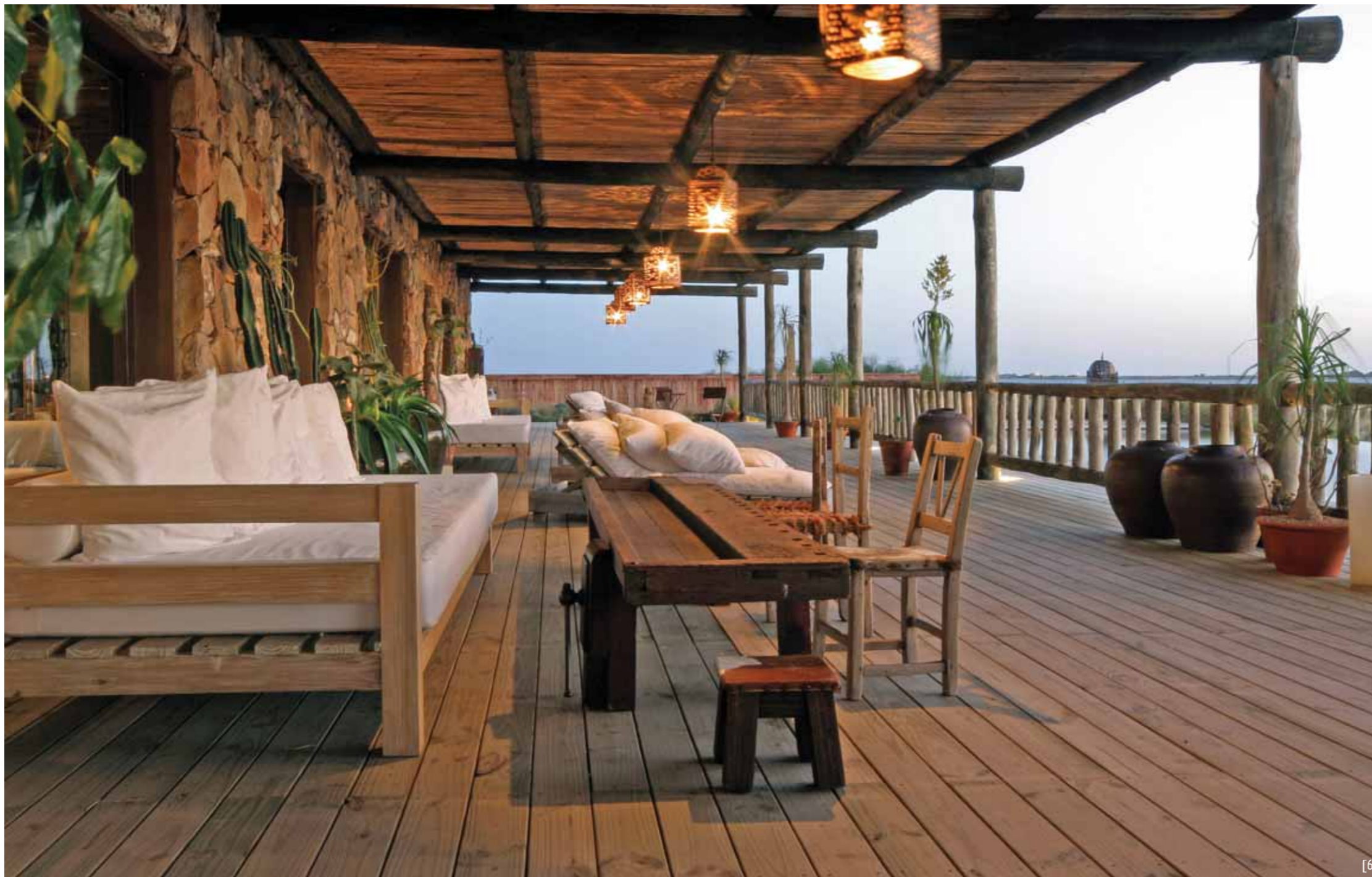
למרות שהבית נמצא בדרום אמריקה, האווירה מזכירה את ספרה של קארן בליקסן והסרט "זיכרונות מאפריקה"